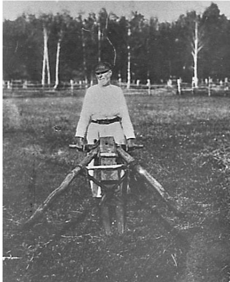
Соха эстонская, вывезенная из Эстонии в XIX в. Колония Бакалдинская Уфимского кантона. 1929 г.