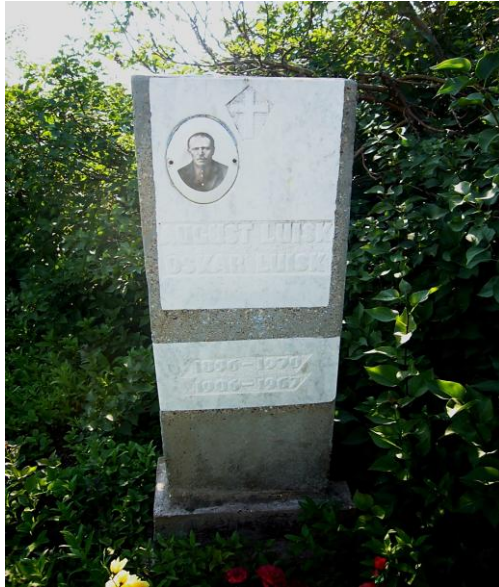
Эстонский надгробный памятник. Кладбище д. Банковка Стерлибашевского района. 2011 г.