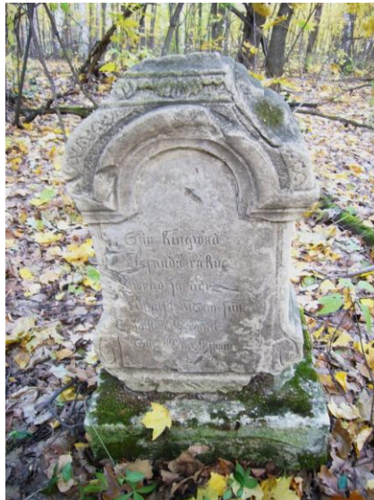
Каменное надгробие конца XIX в. на кладбище бывшей д. Старо- Крымское. Альшеевский район. 2012 г.