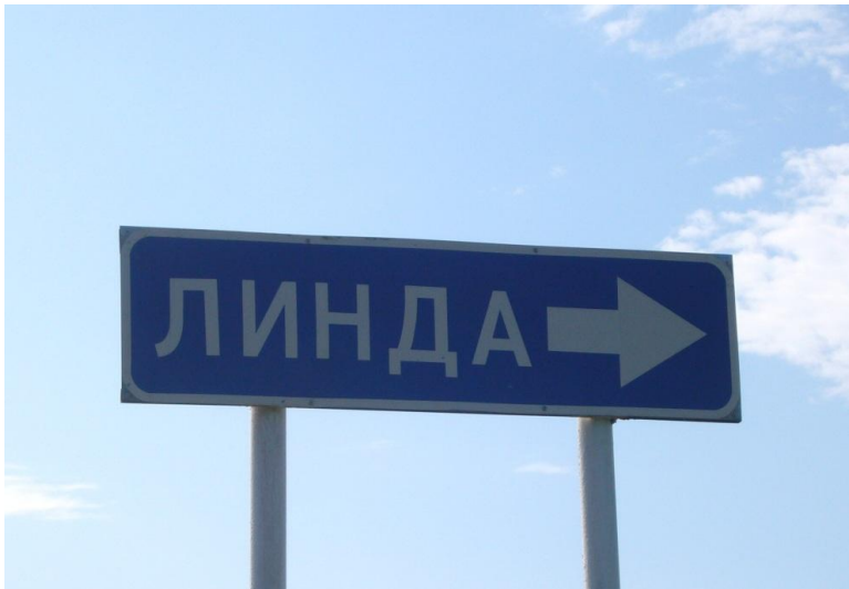
Дорожный указатель в Альшеевском районе (п. Линдовское отделение Раевского зерносовхоза) . 2011 г.