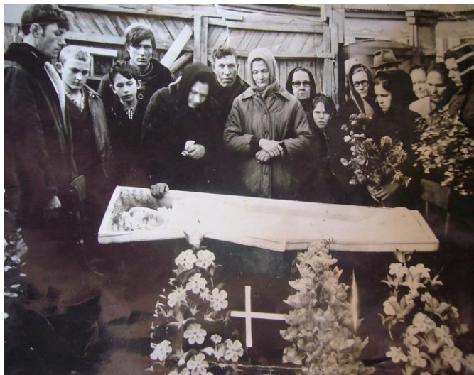
Похороны в д. Линда Альшеевского района. 1950-е гг. Д. Малое Абдрашитово Альшеевского района.