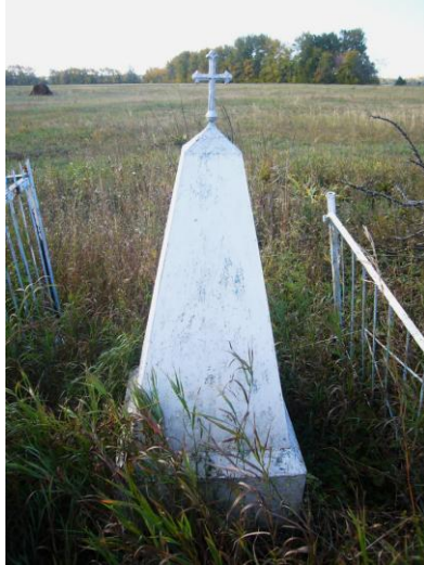
Железный надгробный памятник на кладбище бывшей д. Сядэ. Давлекановский район. 2012 г.