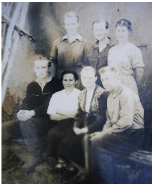
Эстонская семья из д. Сядэ Давлекановского района. 1962 г. Д. Рублевка Давлекановского района.