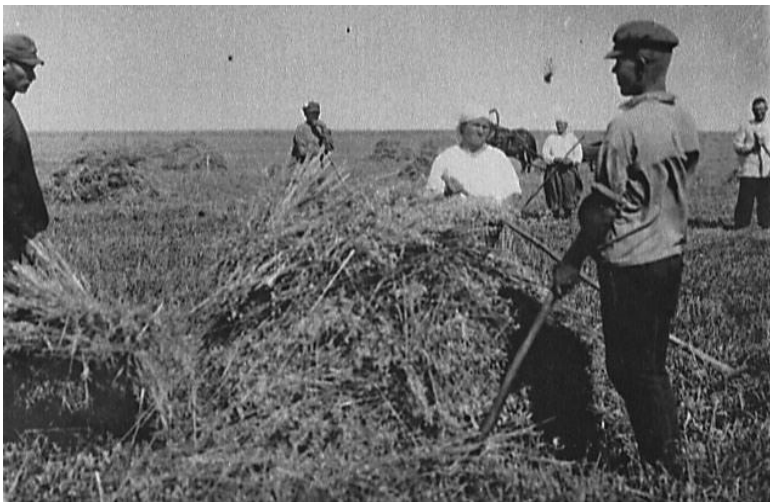
Колхозники копнят скошенный хлеб. С. Сакала Стерлитамакского кантона. 1930 г.