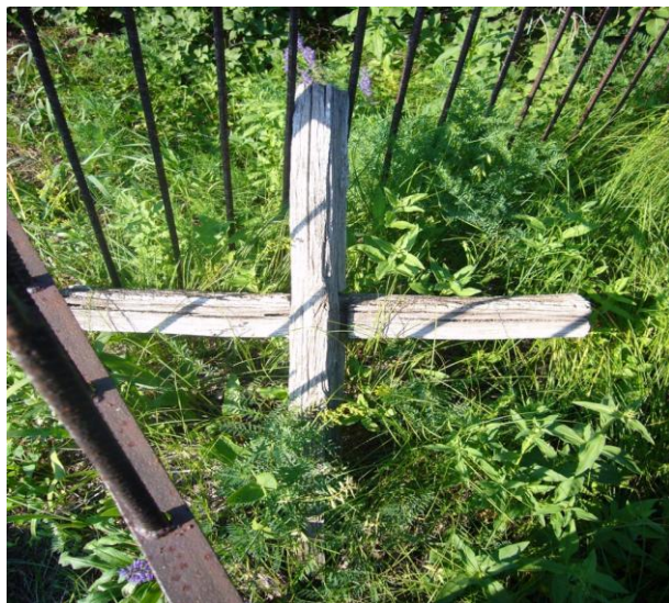
Старый дубовый надмогильный крест. Кладбище д. Банковка Стерлибашевского района. 2011 г.