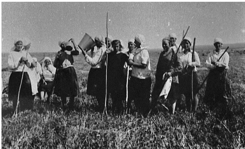
Колхозницы утоляют жажду в поле. С. Сакала Стерлитамакского кантона. 1930 г.