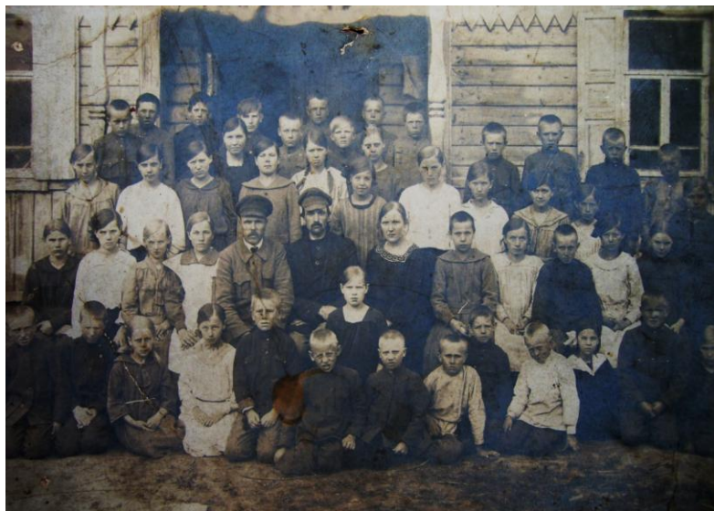
Ученики и учителя школы д. Сакала Альшеевского района. Начало 1930-х гг. С. Раево Давлекановского района.