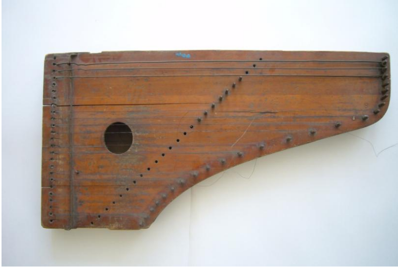
Каннель – эстонский струнный щипковый музыкальный инструмент. Давлекановский районный историко-краеведческий музей.