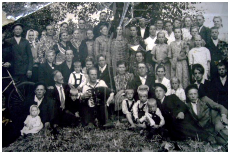
Жители д. Банковка на празднике Иванов день. 1954 г.